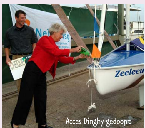
Access Dinghy gedoopt